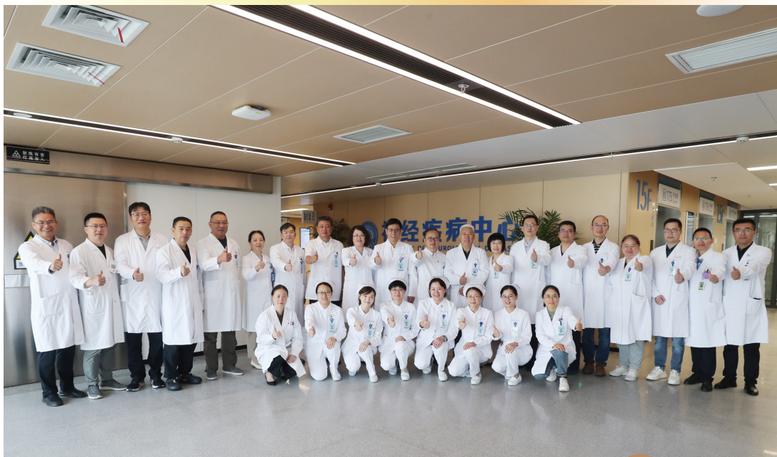
神经疾病中心成立

2025年，异基因造血干细胞移植技术、人工智能辅助治疗技术两项国家级限制类技术成功入选江苏省限制类技术培训基地。截至目前，我院限制类技术培训基地共有8个。