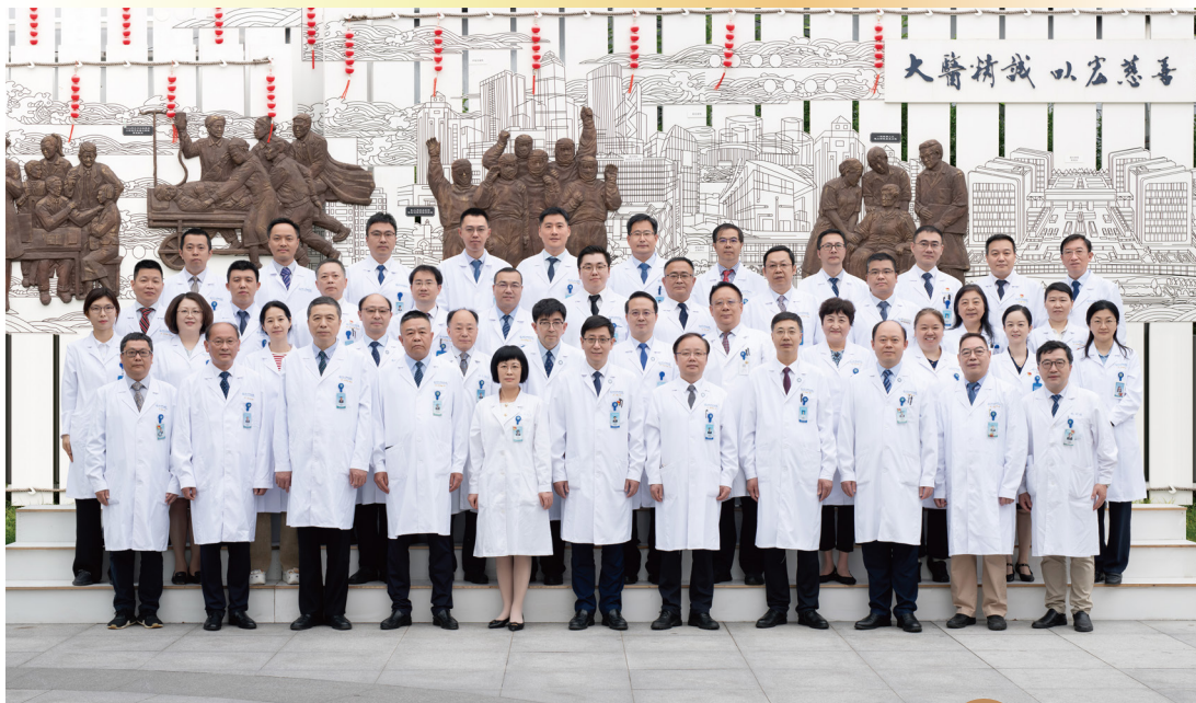
博士研究生导师合影